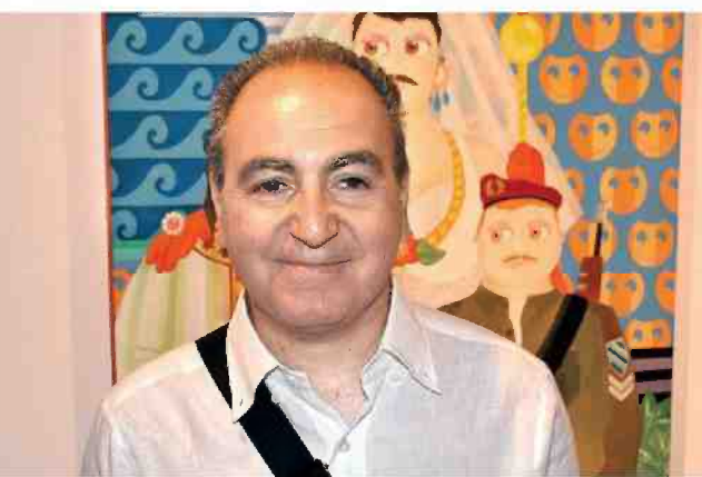
בוקובזה. למעלה: תחן התערוכה

ושואלים מוטיבים מעולם הפרסום והתקשורת החזותית. הפלקטיות משרתת את המסר והשתיחות יותרת, באופן פרדוקסלי, עומק חבוי. הדמויות נראות כמעט אחידות, כולן הן גרסאות דיוקן עצמי של האמן ובכולן העיניים מופנות לצד אחר. "זו אסטרטגיית ציור", הוא מסביר בראיון ל"גלובס" בתערוכה. "הגודש הוויוואלי שאנחנו שרויים בו מחייב צייר כמוני לנקוט תחבולות 'מעולם הפרסום'. יופי מעורר משיכה - זה חוק טבע, והעיניים מושכות את המבט. הציור צריך ללכוד את מבטו של הצופה. תמיד יש בציור שלי עיניים, לא רק בפניהם של האנשים". לא רק עיניים הן מהמוטיבים החוזרים בעבודותיו, שנראות לעתים כקולאז' מצויר של שטיחי דוגמאות שונות. צמחים משבעת המינים, בנייני באוהאוס תל-אביביים טיפוסיים, עצי תפוז וכפיות, מנורות ארט-נובו בסגנון ישראלי-בצלאל, ים, גבעות, פרדס: הוא מפרק את הנוף הקונקרטי והופך אותו לאסופה של סימבולים מקומיים. "אני מצייר ארכיטקטורה שמקורה באירופה, כאפיות ערביות, טנקים ודגלים ביום העצמאות, עד כמה זה באמת מחובר למיקום?". לצד קישוטי סוכה עם 12 השבטים נראים בדוגמת נוף הפופ-ארט שלו גם חלליות ועב'מים, סמלי נוודות, המבטאים חוסר שורשיות.