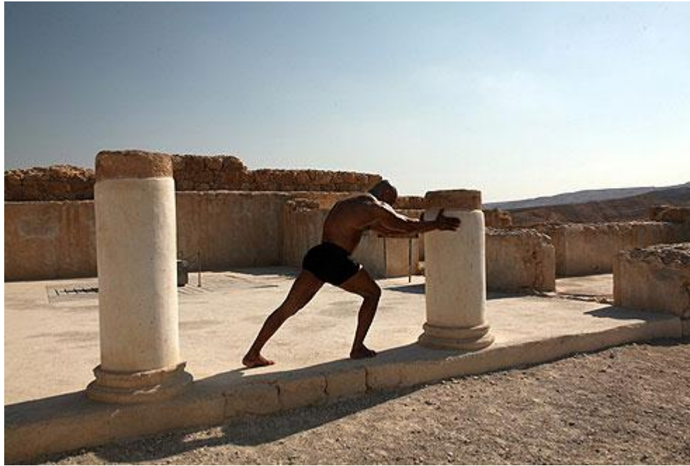
מתוך: "גני עדן מלאכותיים" - האשם מנסה להיות שמשון