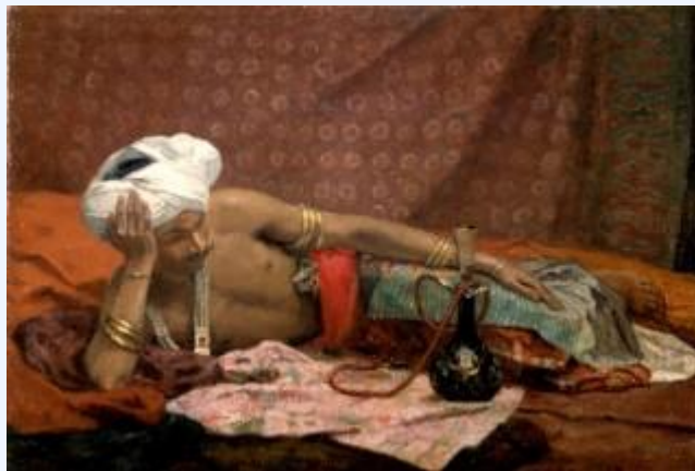
Герман Штрок (1876-1944)

В упомянутой группе «Художники Земли Израиля» особую симпатию к восточным мотивам проявляли жители Яффо Н.Гутман (1898-1980), Р.Рубин (1893-1974) и Ц. Таджер(1900-1988) . Их картины из жизни местных арабов в середине 20-х годов прошлого столетия просто наполнены идиллическим спокойствием, мирным светом и дружелюбным, уважительным отношением к объектам живописи.