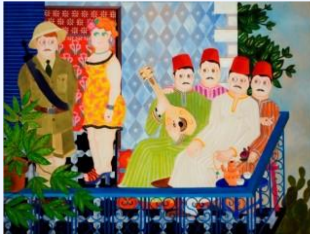
Э.Э.Бокобза. Балкон (2008)