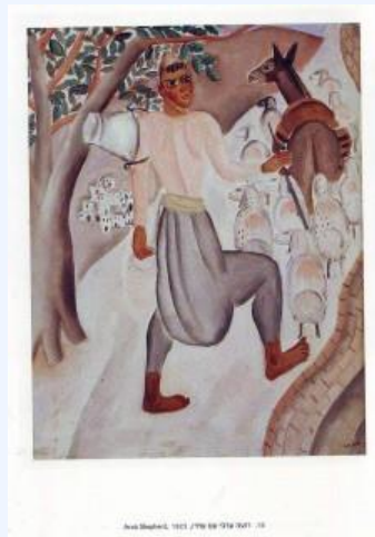
Р.Рубин. Арабский пастух. (1923)