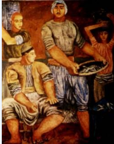
М.Шеми. Рыбаки. (1928)