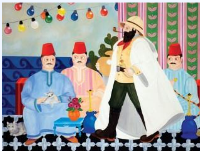
Э.Э.Бокобза «Визит Бориса Шаца» (2009).