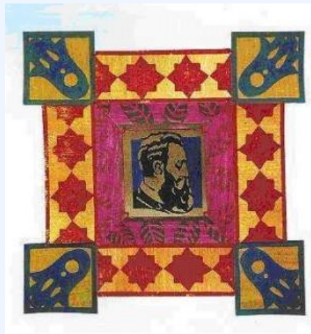
Э.Э.Бокобза Из серии «Искусство для туристов»

Не возникает никаких сомнений в том, что выставочный диалог удался. Но это диалог романтизма с явной фантазией, иронии с гротеском, сионизма с постсионизмом. Диалог ориентализма западного, как некоего красивого образа, и ориентализма восточного, как естественной среды обитания и культурного существования.