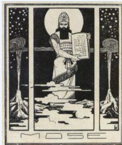
Э.М.Лиlien (1874-1925) Теодор Герцль в образе Моисея.

С начала прошлого века в еврейском ишуве[1] практически безраздельно царили культурные традиции иерусалимской школы искусств «Бецалель»[2], основанные на танахических и исторических сюжетах и декоративных формах.