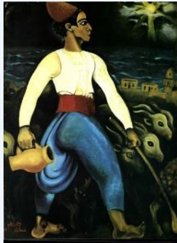
Н.Гутман. Пастух коз. (1926)