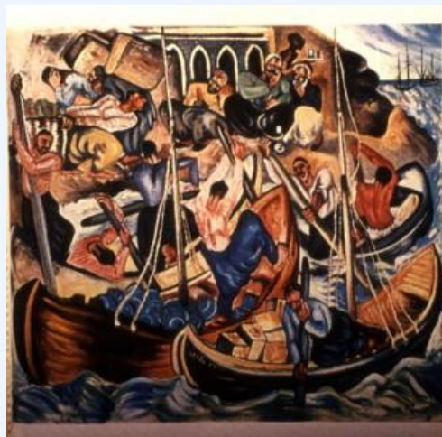
И. Пальди. Порт Яффо. (1928).

Антипафосность сюжета подчеркивалась и средствами выражения: картины писались в духе условного примитивизма, зачастую без учета перспективы и пропорций, с преобладанием чистых ярких красок, наносимых на холст прямо из тюбика.