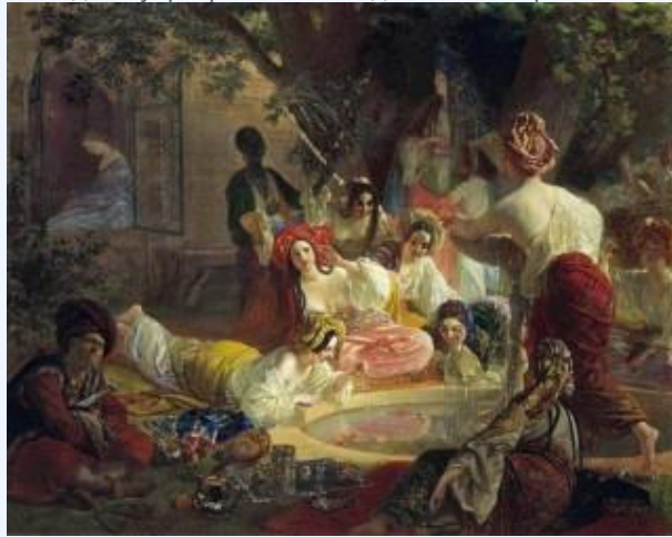
К. Брюллов(1794-1881) Бахчисарайский фонтан (1849), акварель 86.5 x 76, музей А.С.Пушкина,Москва

музыкальную культуру с непрямым влечением в сюжетную ткань нежащихся одалиск, распивание кофе, курение кальяна и ленивое наблюдение течения жизни из-под полуприкрытых век под восточные ритмы композиторов «Могучей кучки».