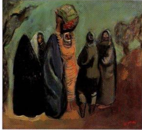
ארבעים בנספח ירושלים, 1927; סגנון ליבוי, אוסף פרטי, 62.3 x 57.5 Arab Women in an Olive Grove, 1927, Oil on Canvas, Private Collection