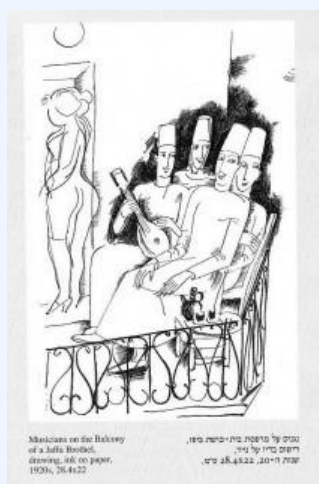
Н.Гутман. Музыканты на балконе яффского борделя (20-е годы)