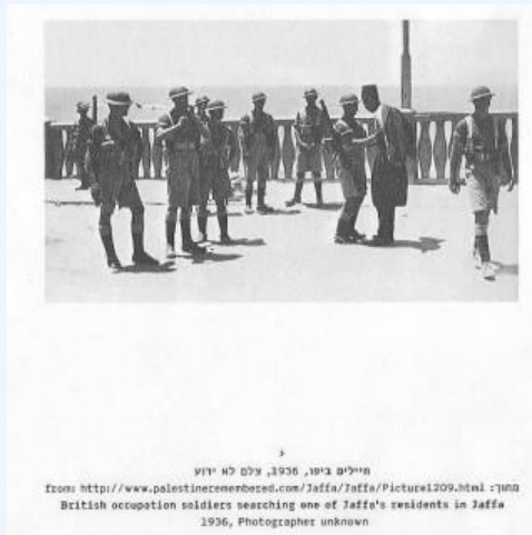
מיילים ביתר, 1936, עלים לא נודע British occupation soldiers searching one of Jaffa's residents in Jaffa 1936