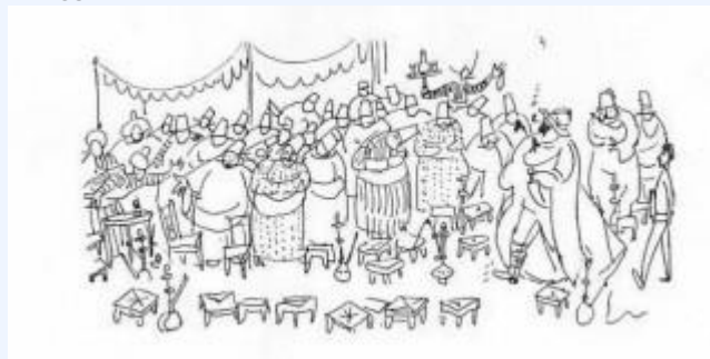
Н.Гутман. «Борис Шац»(1959)

Шац или фотограф Корбман, стойко ассоциируются с колониализмом и милитаризмом, что еще более подчеркивается надменностью и самоуверенностью их поз.