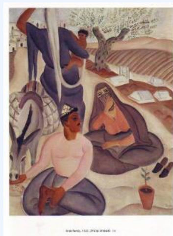
Р.Рубин. Арабская семья (1923)