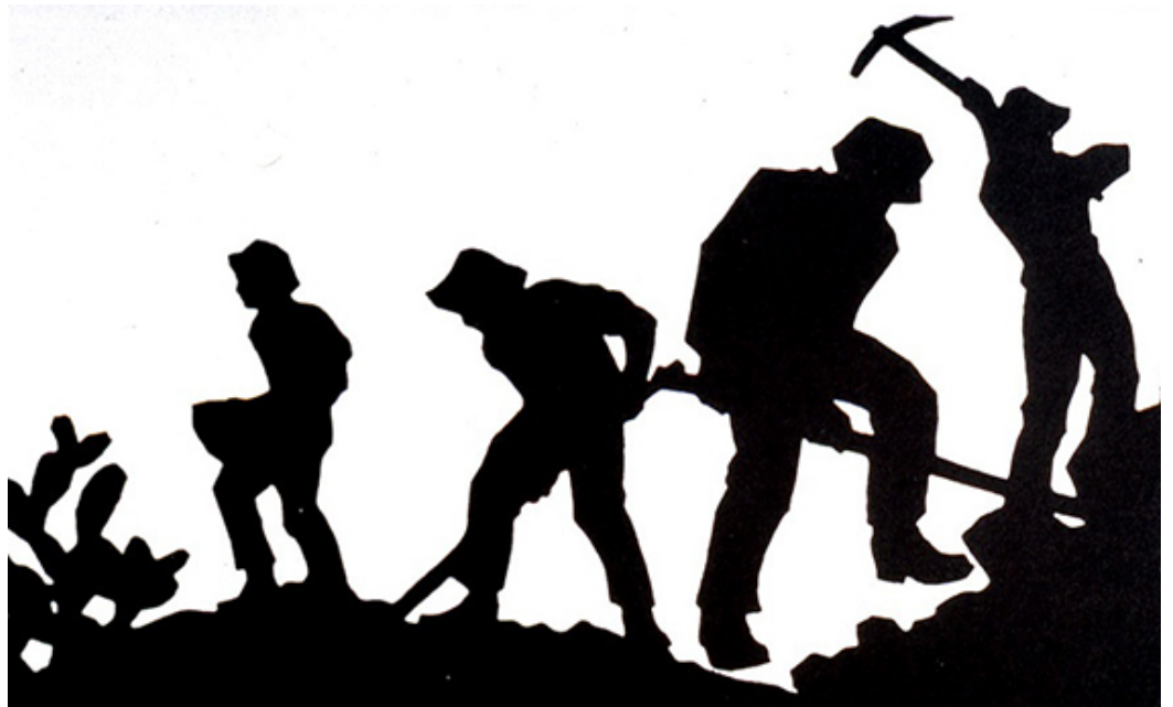
מאיר גור אריה, צלליות חלוצים לקובץ שירים שפורסם בשנת 1925, לקט צלליות ושירי חלוצים, עורך: מרדכי נרקיס, ירושלים