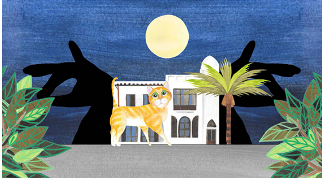
עבודה ומלאכה, אליהו אריק בוקובזה, תמונת יחסי ציבור

"אריק הוא אמן שגוף העבודה שלו עוסק בזהות. אם בשנת 2015 הוא עסק בעניין היהודי, שנה לאחר מכן הוא נגע במוצא הצרפתי שלו ולפני כן הוא עסק בדברים שקשורים לארצישראליות. אני נמנעת מהמילה שיטתי אבל יש הגיון באופן שבו הוא מטפל ברעיונות ובנושאים שמעסיקים אותו, משהו אנליטי מאד. בניגוד לתדמית הלכאורה מתוקה, הוא למעשה מפרק שכבה אחר שכבה בישראליות וב-20 השנים האחרונות שבהן הוא מציג, נוצר גוף עבודה שאין פן בזהות שלו שאינו מטופל. דבר יוצא מתוך דבר".