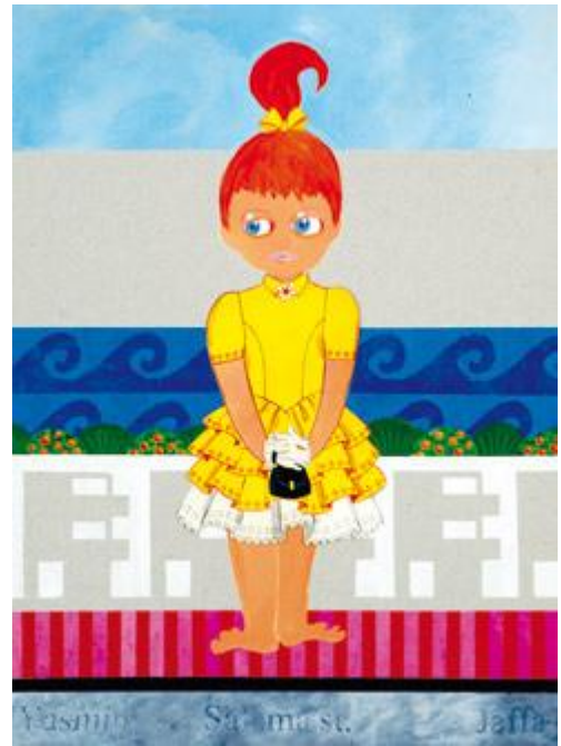
יסמין, רח' סלאמה