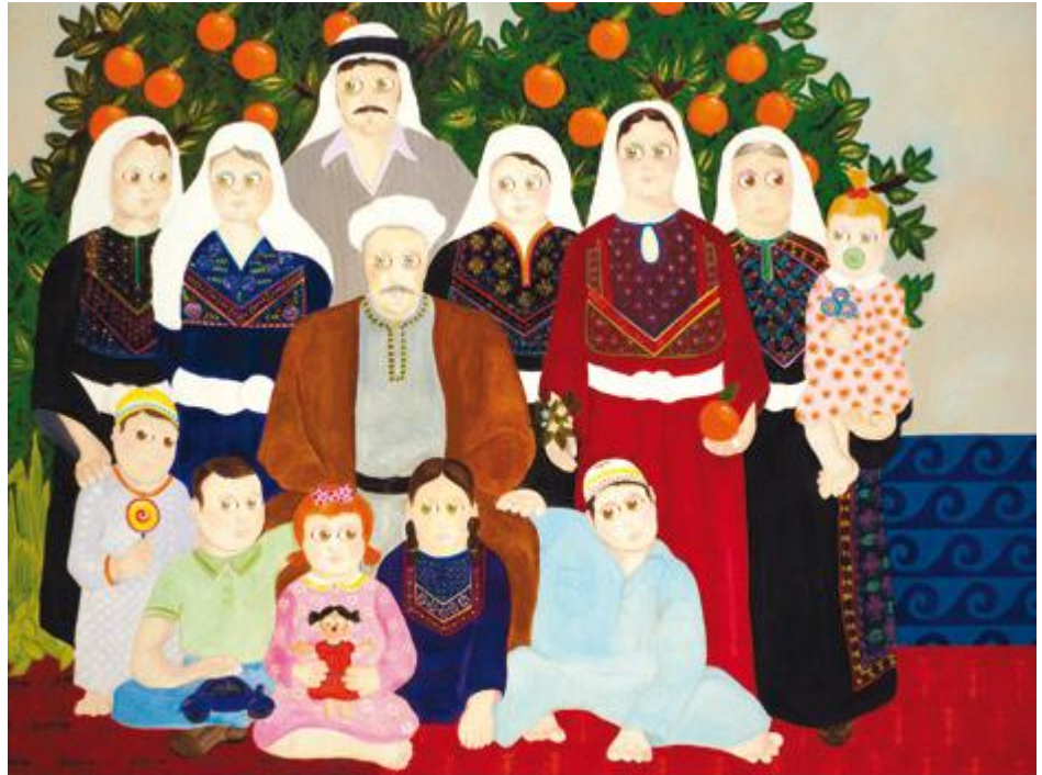
משפחת הפרדסן (יפו, 1939), 2007

"לא נהייתי, די סבלתי, אבל הפכתי את הסבל לדגל. לא הוזמנתי למסיבות ולא הייתי מקובל בשום מקום. ישבתי לבד בבית. ציירתי, ניגנתי בפסנתר. המצב השתנה בתיכון, הלכתי ל'בליך' ברמת חן ושם אפילו הדגשתי את החריגות שלי עוד יותר, אבל בגלל שהייתי תלמיד טוב, ומאוד פעיל חברתית, וגם הארץ השתנתה והאוכלוסייה ברמת חן היתה יותר פתוחה, הפכתי למאוד מקובל. זה היה הפרס על זה שישבתי לבד בבית ביסודי".